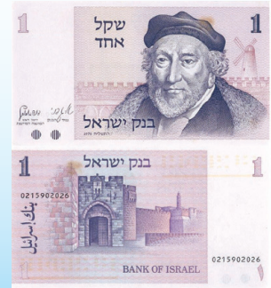
שטר של שקל אחד (Wikipedia)

במסגרת התוכנית הכלכלית בשנת תשמ"ה (1985), נקבע השקל החדש (ש"ח) כמטבע הרשמי של ישראל, כשהוא מחליף את המטבע הקודם, השקל. כל שקל חדש ישנים. בשקל החדש היו 100 אגורות, והוא סומן בסימן ש"ש. שבא אחרי המספר. בתחילה הודפסו שטרות של שקל חדש אחד, וזמן קצר לאחר מכן הונפקו מטבעות בעלי ערך זהה. על המטבע מופיע ציור של שושן, הלקוח ממטבעות מהתקופה הפרסית בארץ ישראל, והאותיות "יהד" בכתב עברי קדום.