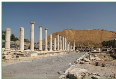
עתיקות בית שאן

בית שאן היא עיר במחוז הצפון בישראל, בבקעת בית שאן, ונחשבת לאחת הערים העתיקות בארץ, המיושבת ברציפות במשך אלפי שנים. בית שאן נזכרת בתנ"ך, בדברי חז"ל ובמקורות חיצוניים, ונקראת גם בשמות אשאן, בישאן וסקיתופוליס. העיר נכבשה, נהרסה ונבנתה מחדש פעמים רבות בידי הצלבנים, המוסלמים והמונגולים, וחשיבותה היתה רבה בשל מיקומה על הדרך בין מצרים לסוריה. במהלך מלחמת העצמאות עזבו אותה תושביה הערבים והיא יושבה מחדש בעולים יהודים מאיראן, עיראק וצפון אפריקה. בשנת תשנ"ט (1999) הוכרזה בית שאן כעיר. כיום גרים בה למעלה מ-17,000 תושבים.