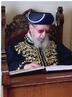
הרב עובדיה יוסף זצ"ל

הרב עובדיה יוסף זצ"ל (תרפ"א-תשע"ד, 1920-2013) היה מגדולי הרבנים והפוסקים בני זמננו. הרב שנולד בבגדאד ועלה עם משפחתו לארץ בגיל 4, כיהן כרב הראשי לישראל "הראשון לציון", וכנשיא מועצת חכמי התורה של מפלגת ש"ס. מגיל צעיר בלט בכישרונו בלימוד התורה, והיה בעל בקיאות עצומה בכל חלקי התורה, עד שזכה בפי רבים לתואר הכבוד "מרן". חיבר ספרים וחיבורים תורניים רבים, שבמרכזם ספרי "ביע אומר" ו"חוה דעת". כמו כן, היה ידוע בדרשותיו שניתנו מדי מוצאי שבת בשכונת הבוכרים בירושלים ושודרו בלוויין. פעל "להחזיר עטרה ליושנה" – חיזוק הזהות הדתית-ספרדית וקבלת השולחן ערוך כפוסק מחייב לכל בני ארץ ישראל. בהלווייתו השתתפו מאות אלפי אנשים שבאו לכבד את דמותו וזכרו.