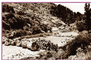
מחסום ערבי בשער הגיא נגד שיירות יהודיות, 1948

מבצע הראל היה מבצע שערכה חטיבת הראל של הפלמ"ח במלחמת השחרור, ומטרתו היו להעביר שיירות מזון ואספקה לירושלים הנצורה, ולהעלות את חטיבת הראל לעיר. על המבצע פיקד יצחק רבין. הגדוד הרביעי של הפלמ"ח כבש את הכפר סאריס ששלט על הדרך לירושלים, ולמחרת יצאה שיירה של 227 משאיות ירושלים, העבירה לשם מטען וחזרה לתל אביב. לאחר מכן יצאה לירושלים שיירה נוספת שבה היו דוד בן-גוריון וכוחות חטיבת הראל. הערבים תקפו את השיירה שהתנהלה באיטיות והמטירו עליה אש תופת. לוחמי הגדוד הרביעי הגיעו למקום במשוריינים וחילצו את השיירה. שתי שיירות הראל, שכללו סך הכול כ-600 משאיות, העבירו לירושלים מטענים חיוניים של מזון, תרופות, נשק ודלק שאיפשרו את עמידת העיר בשבועות הבאים שבהם הייתה נתונה במצור.