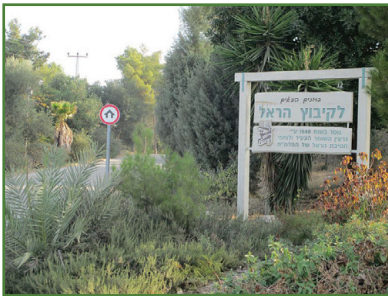
קיבוץ הראל

קיבוץ הראל הוא קיבוץ מזרם הקיבוץ הארצי, הנמצא במחוז ירושלים ושייך למועצה האזורית מטה יהודה. הקיבוץ הוקם בשנת תש"ח (1948) על אדמות הכפר הערבי בית ג'ז, שתושביו נמלטו ממנו במהלך מלחמת העצמאות ולא הורשו לחזור. מייסדי היישוב היו יוצאי חטיבת הפלמ"ח הראל, שנלחמה על פריצת הדרך לירושלים ושחרור פרוזדור ירושלים במלחמת העצמאות. רוב המייסדים היו ישראלים משוחררי פלמ"ח, ומיעוטם היו עולים מפולין ומהונגריה. כיום גרים ביישוב למעלה מ-200 תושבים. הקיבוץ עוסק בייצור יין באמצעות יקב הנמצא בשטח הקיבוץ.