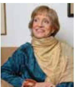
דבורה עומר

הייתה סופרת ילדים ונוער. נולדה בקיבוץ מעוז חיים למשפחת מוסנזון. הוריה היו פעילים בהגנה, וכשהייתה בת 11 נהרגה אמה בתאונת אימונים. אביה ערך את עיתון הנוער העובד, "במעלה", בו פרסמה דבורה את סיפוריה הראשונים. היא למדה בסמינר אורנים ועבדה כמורה בארץ ובקנדה. בשנת תשט"ו (1955) החלה לכתוב בעיתון "דבר לילדים" מדור בשם "דפי תמר", שהפך אחר כך לספר. בעקבותיו כתבה עשרות ספרים נוספים והפכה לאחת הסופרות האהובות על הילדים והנוער בישראל. רבים מספריה מתארים את חייהן של דמויות היסטוריות כמו שרה אהרנסון, איתמר בן אב"י, דוד בן גוריון ואחרים. דבורה עומר זכתה בפרסים רבים על ספריה, ובשנת תשס"ו (2006) הוענק לה פרס ישראל על תרומתה לתרבות הישראלית.