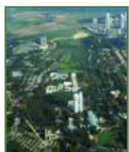
מכון ויצמן למדע

מכון ויצמן הוא מכון מחקר מדעי שנמצא ברחובות. זהו המוסד השלישי להשכלה גבוהה שהוקם בישראל, אחרי הטכניון והאוניברסיטה העברית. הוא הוקם בשנת תרצ"ד (1934) בזימנתו של חיים ויצמן, ונקרא בתחילה מכון זיו על שם משפחת התורמים שמימנו אותו. לקראת יום הולדתו ה-70 של ויצמן שחל בתש"ד (1944) עבר המכון הרחבה משמעותית ושמו שונה, בהסכמת משפחת זיו, ל"מכון ויצמן למדע". מכון ויצמן כולל חמש פקולטות: לביולוגיה, לכימיה, לכימיה, לפיזיקה ולמתמטיקה ומדעי המחשב, והללו נחלקות ל-17 מחלקות מדעיות. מכון ויצמן פעיל גם בתחום החינוך המדעי לילדים, לבני נוער ולמבוגרים. מחלקה מדעית נפרדת במכון, הקרויה "המחלקה להוראת המדעים", עוסקת בחקר ההוראה ובפיתוח תוכניות לימודים. המחלקה נוטלת חלק מרכזי בפיתוח מקצועי של מורימדע ומתמטיקה בארץ.