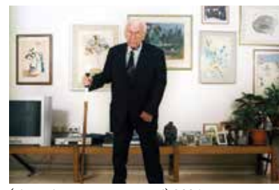
אפרים קציר - 2006

היה הנשיא הרביעי של מדינת ישראל. הוא נולד בקייב ועלה עם משפחתו לארץ בתחילת שנות ה-20. למד ביוכימיה באוניברסיטה העברית, קיבל תואר דוקטור ובשנת תש"ח (1948) התמנה למפקד חיל המדע. לאחר מכן הצטרף למכון ויצמן למדע, הקים את המחלקה לביופיזיקה ועמד בראשה. באותו הזמן גם היה חבר ב"שורת המתנדבים". כיהן כמדען הראשי של משרד הביטחון ופעל לטיפוח החינוך המדעי לנוער בארץ. בשנת תשל"ג (1973) נבחר לנשיא הרביעי של מדינת ישראל, וכיהן בתפקיד זה כחמש שנים, ולאחר מכן חזר לפעילות מדעית. עבודתו המדעית זכתה להערכה רבה, ובעקבותיה זכה קציר פרס ישראל, פרס רוטשילד, פרס ויצמן, פרס טשרניחובסקי ופרס יפן. הוא נפטר בגיל 93 בביתו שבמכון ויצמן ונקבר ברחובות.