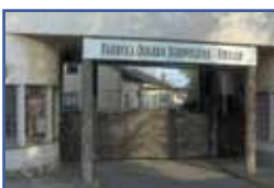
המפעל לייצור אמיייל של אוסקר שינדלר בקרקוב

הרשימות הללו שהכינו שינדלר ושטרן כללו בסופו של דבר כ-1,200 שמות, שבזכות זה ששינדלר דרש מהגרמנים בתוקף שהם יעבדו אצלו במפעל - ניצלו חייהם. רשימת השמות הזו נקראת רשימת שינדלר. הסרט המפורסם של סטיבן ספילברג "רשימת שינדלר" מבוסס על הסיפור הזה של הרשימות.