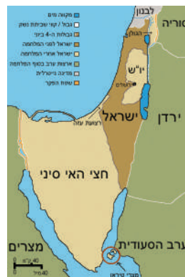
שינויים טריטוריאליים עקב המלחמה, Wikipedia

מלחמת ששת הימים התנהלה בין ישראל למצרים, סוריה וירדן מכ"ו אייר עד ב' סיון תשכ"ז. לאחר תקופת המתנה מתוחה, בה איימו מדינות ערב להשמיד את ישראל, נפתחה המלחמה בהתקפת פתע של חיל האוויר הישראלי שהצליחה להשמיד את רוב חילות האוויר של האויב. בכך זכתה ישראל ליתרון משמעותי, ובמהלך המלחמה הביסה את צבאות ערב וכבשה את יהודה, שומרון, רצועת עזה, ירושלים המזרחית, רמת הגולן וסיני, כשהיא מגדילה בכך את שטחה פי שלוש. הניצחון הגדול ושחרורם של חלקים נרחבים מארץ ישראל עוררו תחושת התלהבות גדולה בישראל.