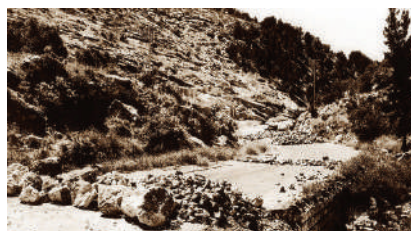
מחסום ערבי בשער הגיא נגד שיירות יהודיות, 1948

במהלך מלחמת העצמאות עמדה ירושלים במרכזם של קרבות רבים. הערבים השתלטו על הדרכים המרכזיות המובילות לחלקה היהודי של העיר, ומנעו מעבר של שיירות לוחמים, מזון ואספקה. ניסיונות רבים נעשו לפרוץ את המצור באמצעות שיירות משוריינים ולהשתלט על הדרכים, והכוחות היהודים ספגו אבידות קשות במהלך קרבות אלה. מבצע נחשון ומבצע הראל היו שניים מהמבצעים שבמהלכם הצליחו להעביר שיירות לירושלים. מאוחר יותר נסללה דרך גישה שכונתה "דרך בורמה", שהצליחה לפרוץ את המצור הירדני על ירושלים הערבית, ובמבצע שילוח הותקן צינור מים שהעבי מים לעיר מאזור חולדה. בזכות מאמצים אלה הצליחו תושבי ירושלים להחזיק מעמד במלחמה.