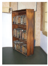
כוננית הספרים שהסתירה את הכניסה למחבוא של אנה פרנק ומשפחתה, Wikipedia מעלה היצירה

במהלך מלחמת העולם השנייה, ב-10 במאי 1940 תקפה גרמניה את הולנד, למרות שזו הכריזה על ניטרליות כאשר פרצה המלחמה. כיבוש הולנד נמשך חמישה ימים, והיא נכנעה במהירות. באותה תקופה חיו בהולנד כ-140,000 אזרחים יהודים, ועוד 30,000 פליטים שהגיעו אליה ממדינות אחרות. מיד לאחר הכיבוש החלו הנאצים לגזור גזירות על היהודים, להגביל את תנועותיהם ולשלוח אותם למחנות ריכוז והשמדה. רק כמה עשרות אלפי יהודים בהולנד נותרו בחיים בסוף המלחמה. בין היהודים שהסתתרו בהולנד ונתפסו לבסוף היו אנה פרנק ובני משפחתה.