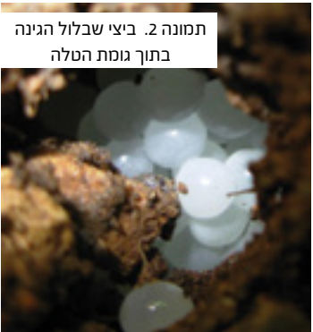
תמונה 2. ביצי שבלול הגינה בתוך גומת הטלה

עמו וכו'". מעניין לראות שהרא"ש (בחולין) החליף בפירוש זה את השם "חומט" ב"שבלול": "לא בלו שלמותיכם וכשהתינוק גדל לבושו גדל ונעלו גדל עמו אל תתמה שהרי בא וראה מביתו של שבלול כל זמן שהוא גדל ביתו גדל עמו". פירוש הרא"ש מגדיר באופן מדויק יותר את מהותו של ה"לבוש" שאותו תיאר המדרש. ה"לבוש" הוא "ביתו" של החילזון כלומר הקונכייה. לכאורה ניתן היה לזהות גם את החומט כצב משום שביתו גדל עמו, אך אין הוא עונה לתנאי של גודל כ"עדה".