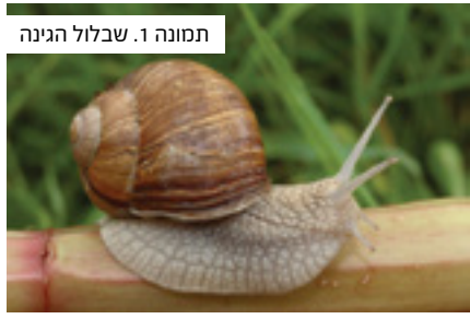
תמונה 1. שבלול הגינה

בחולין (קכב ע"א) פירש רש"י: "חומט - לימצ"א שתחלת בריותו בכעדה. צא ובדוק בתיק שלה שגדל והולך עמה תחלתו כעדה ממש הוא בשוליו" (בדומה לכך פירש גם בסוגייתנו). מסתבר שכוונתו במשפט "בתיק הגדל עמה" היא לקונכייה המאפיינת את מחלקת החלזונות. גם בפירושו לתורה (ויקרא, יא ל) כתב כך: "החמט - לימצ"ה". בצרפתית בת ימינו limace היא חשופית, כלומר חלזון ללא קונכייה השייך לסדרת השבלולים (מקובל להבחין בין השם חלזון שהוא שמה של מחלקת החלזונות לבין השם שבלול המתייחס לבני סדרת השבלולים) אך שם זה כולל גם את