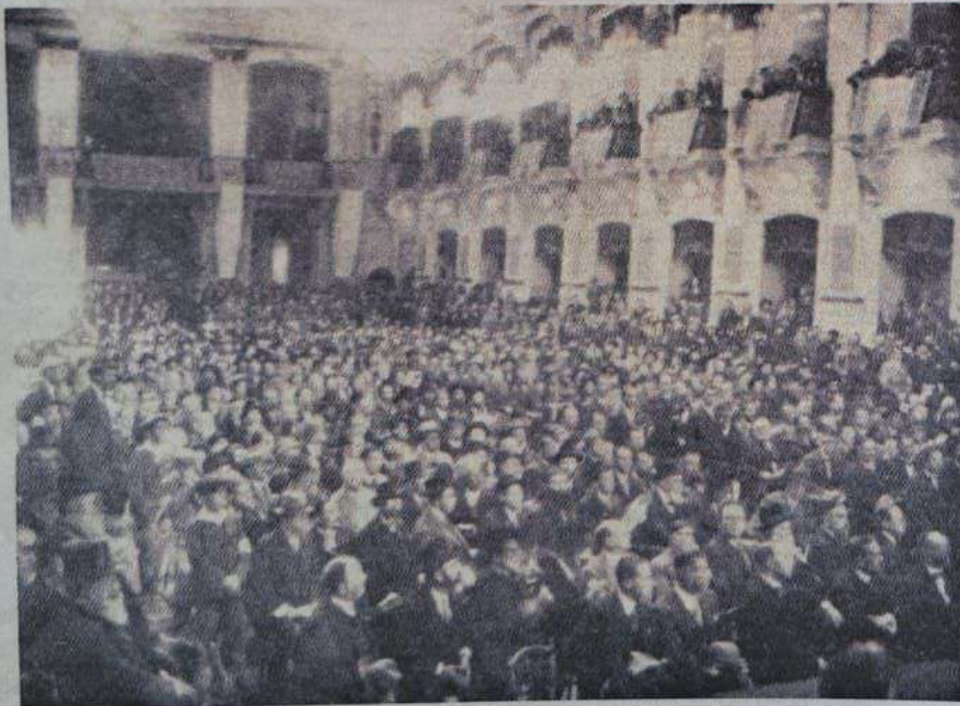
אחד המושבים בכנסיה הגדולה של אגודת ישראל בוינה

י"ש"כ ותשנ"ח למכובדני הרב אדרן פר"ב שיחי, שרפנה אותנו אל שיחה מיוחדת זו.