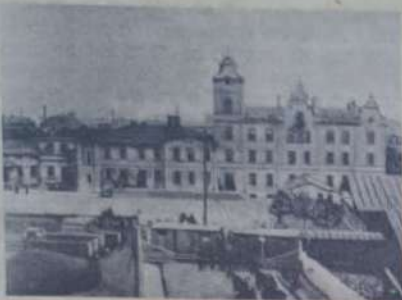
העיר לודז' בפולין

כשהוכיחו בפני רבינו, כי מרן ה"חפץ חיים" זי"ע גם הוא שמת על הצעה, באמרו שעל ידי כך תתרחבה ידיעת התורה בעוד מסכתות, שלא למדו בהן כל כך, כמו מסכת נזיר וסדר קרישים נענה רבינו - בדאי שגם זה סברא בכוננה הגר"מ שפירא לתועלת הכלל. "היתה בכלל ישראל התעוררות כללית, בעקבות הדף היומי" סיים רבינו את שיחתו.