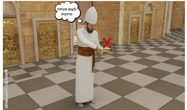
יא: 'הפסח ששחטו שחרית בי"ד שלא לשמו'.

כהן שקמץ מנחה שמביאים על חטא [בקרוב עולה ויורד] לשם מנחה אחרת, המנחה פסולה. קרבן פסח ששחט בזמנו (י"ד ניסן בין הערביים) שלא לשמו פסול, אבל שלא בזמנו כשר. אם נשחט בי"ד ניסן בבוקר, נחלקו תנאים האם כשר. וכן נחלקו הראשונים להלכה.