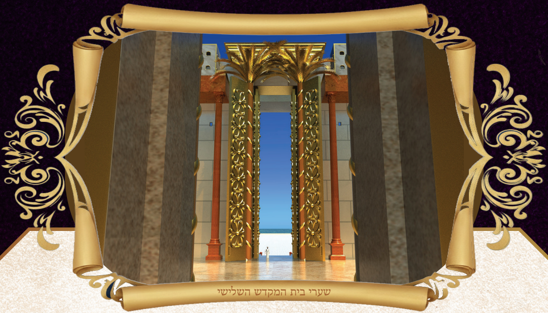
שערי בית המקדש השלישי

(פיוט לתיקון חצות לרבי חיים הכהן מן ארם צובה זצלה"ה)