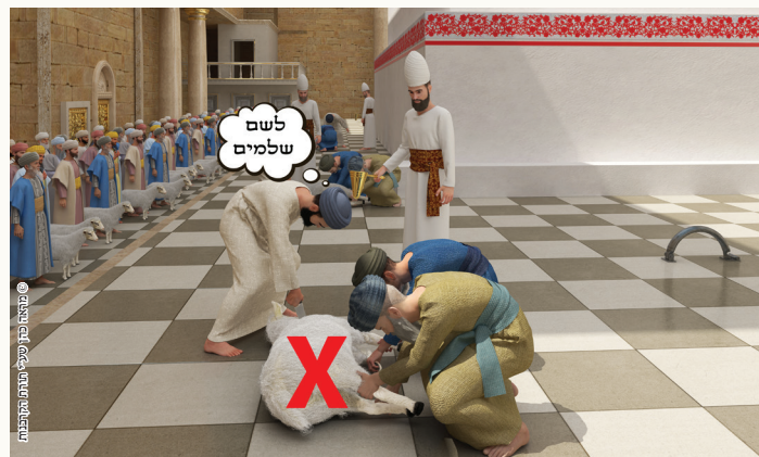
ח: 'ובשאר ימות השנה, לשמו פסול שלא לשמו כשר'. אם שחט קרבן פסח בשאר השנה - לשמו פסול כיון שדינו להיקרב דוקא ב"ד בניסן, שלא לשמו כשר כיון שנעקר מלהיות קרבן פסח ונעשה קרבן שלמים.