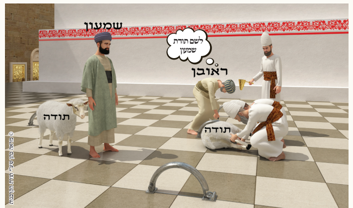
ז. 'תודה ששחטה לשם תודת חבירו, רבה אמר כשרה רב חסדא אמר פסולה'.

מי שעבר על עשה ועשה תשובה והתכפר לו, הוא מביא את העולה כמו אדם שמביא מתנה כשבא להקביל את פני המלך אחרי שחטא לו.