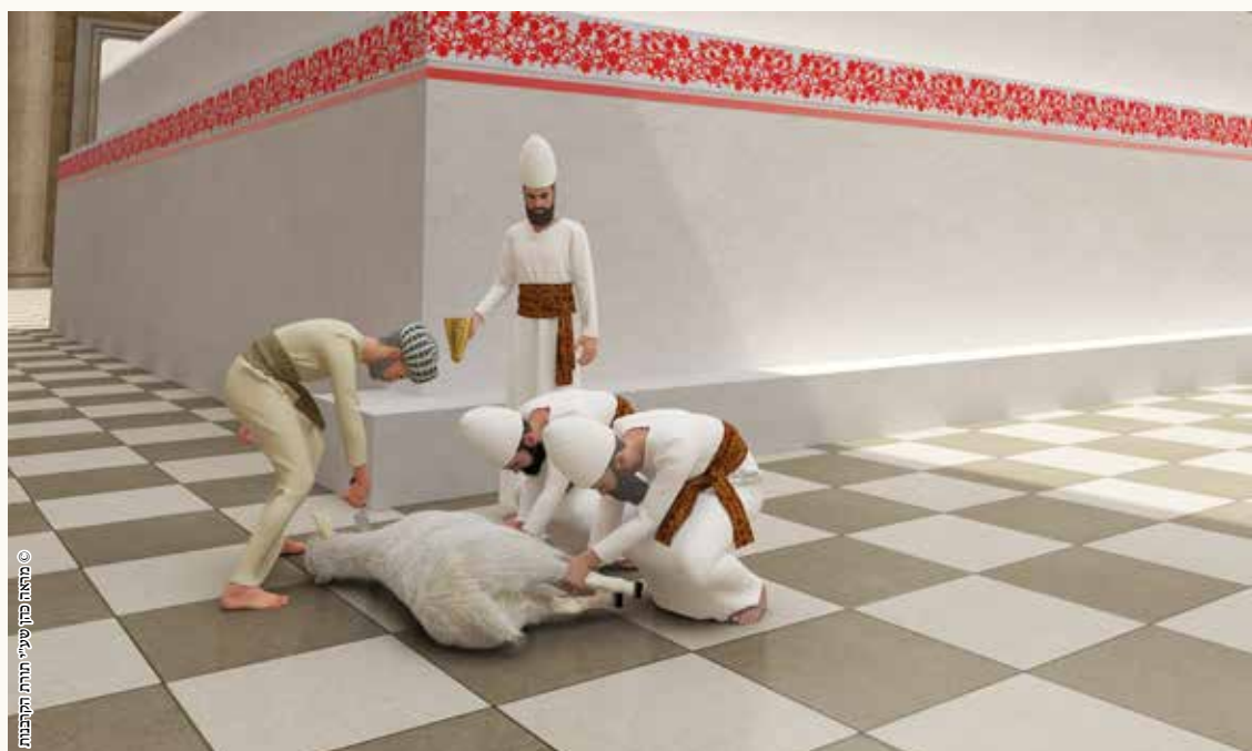
מראה כהן שיעי תורתו הקרבנות

דעת רבי שמעון שמחשבת שלא לשמה אינה פוסלת בהולכת הדם למזבח, כיון שאינה עבודה חשובה, שהרי אפשר לבטל את ההולכה לגמרי על ידי שישחט ליד המזבח ומיד יזרוק את הדם. הלכה כחכמים שמחשבה פוסלת גם בהולכת הדם.