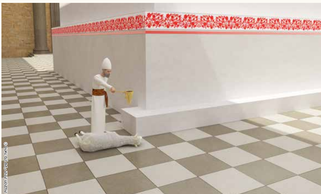
© מאת מרת שטיינר תורת הקבלות

הולכה קטנה של דם - היינו ששחט ליד המזבח וצריך רק להושיט את ידו כדי לזרוק את הדרם על המזבח, גם ר' שמעון (שחולק במשנה) סובר שמחשבה פוסלת בהולכה זו - כיון שאי אפשר לבטל אותה. [ואף שזה הולכה שלא ברגל].