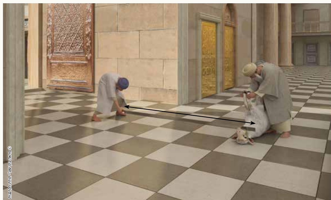
© מאת פת שיעורי תורת התקופות