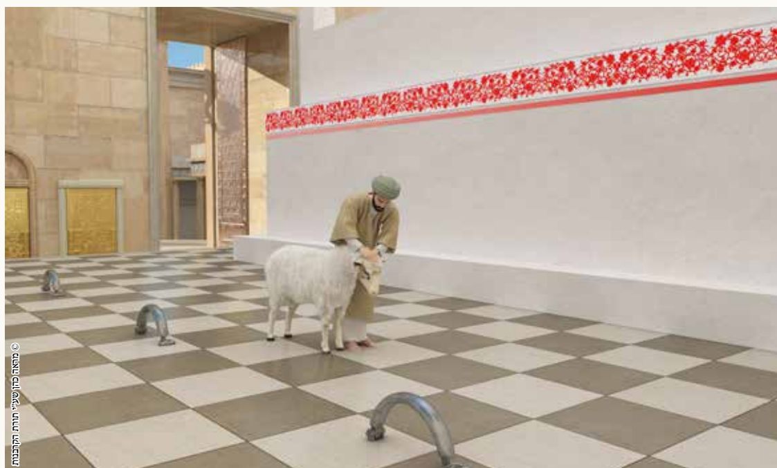
© מראה כהן שיעי ירחמי הקובנות

סמיכה על הקרבן צריכה להיות תיכף - סמוך לשחיטה, בלי הפסק ביניהם.