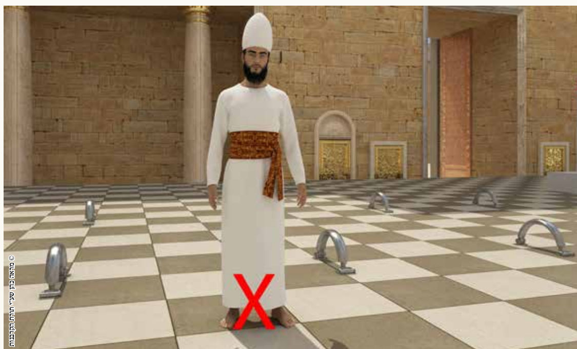
© מהארץ כתר שני תורת התקנות