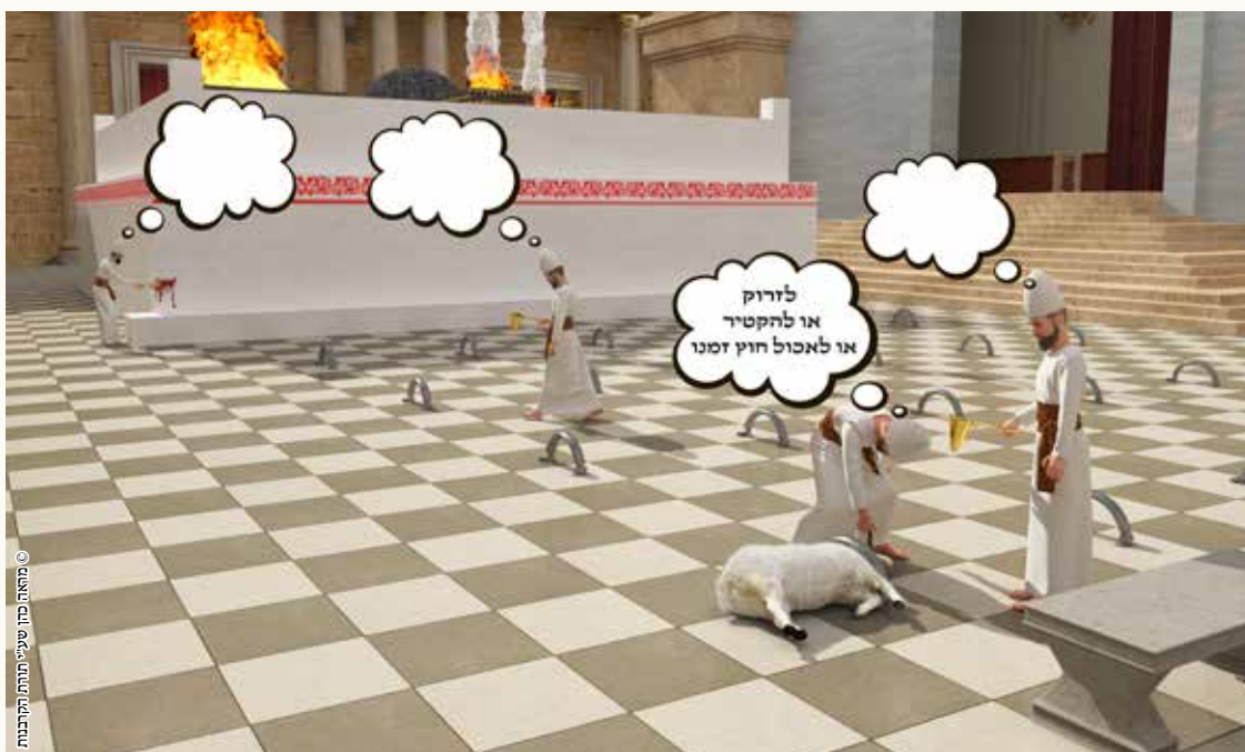
© מאת: כהן שני תורתו הקרבנות

בחושב להקריב או לאכול חוץ לזמן הראוי - שהקרבת נעשה פיגול (והאוכל מהבשר חייב כרת), הוא רק באופן שהדם שהוא מתיר את הקרבן נקרב כמצוותו בלי פסול אחר.