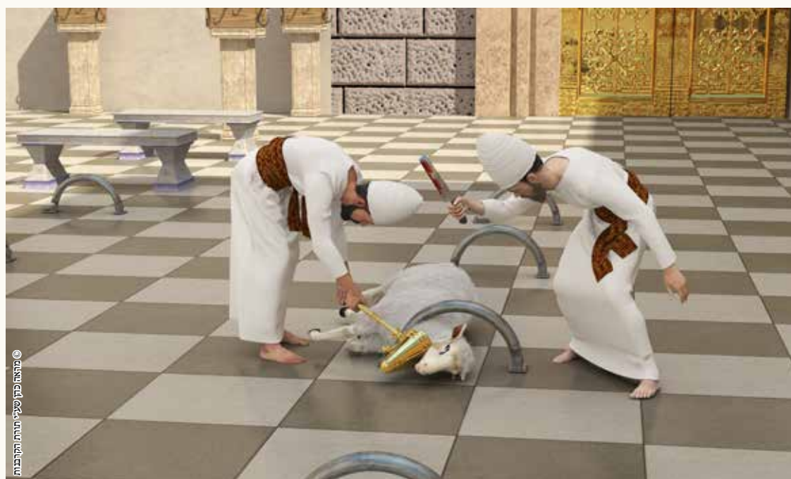
© מאת פתח שערי תורתו הקולנועית