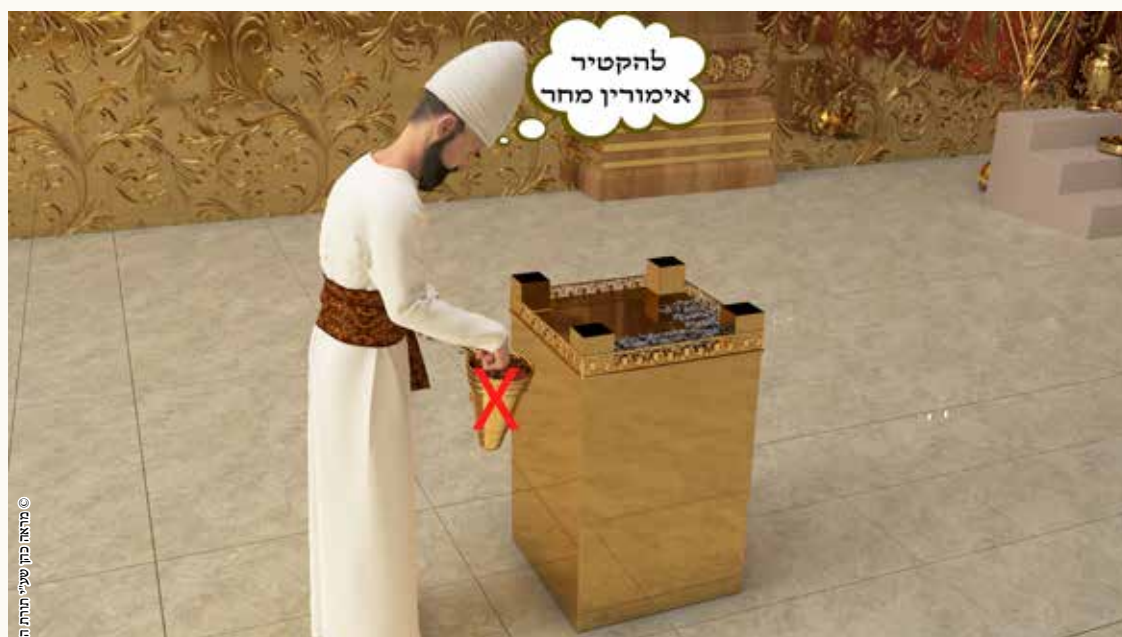
מראה כהן שיעי תורתו הקרבנות