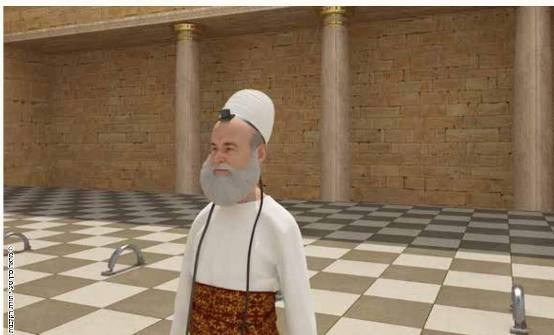
© מראה כהן שיעי תורת הקבלות

תפילין של יד חוצצות בין בגדי הכהונה ליד ואסור להניחם בשעת העבודה, אבל תפילין של ראש אינן חוצצות כיון שיש מקום להניחם מחוץ למצנפת ומותר להניחם בשעת העבודה.