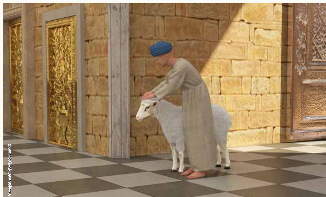
© מראה כהן שיעי ירחמי הקובנות

לג. 'חוץ מזו שהיתה בשער נקנור שאין מצורע יכול להכנס לשם'.