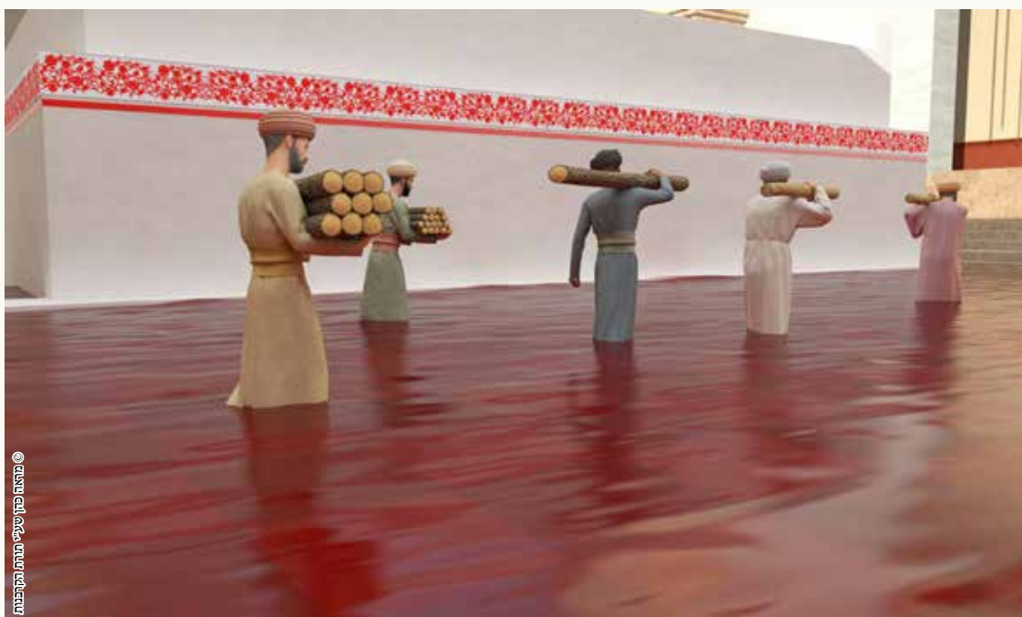
© מאת פתח שיעור תורת המקובות

מסקנת הגמ' שהם הולכים בתוך הדם רק בהולכת העצים למערכה שאין זה עבודה.