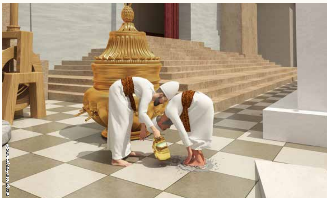
© מהאר כותב שיעור תורת התקנות

אפשר לקדש ידיים ורגליים בכל כלי שרת [אבל מצוה לקדש מהכור].