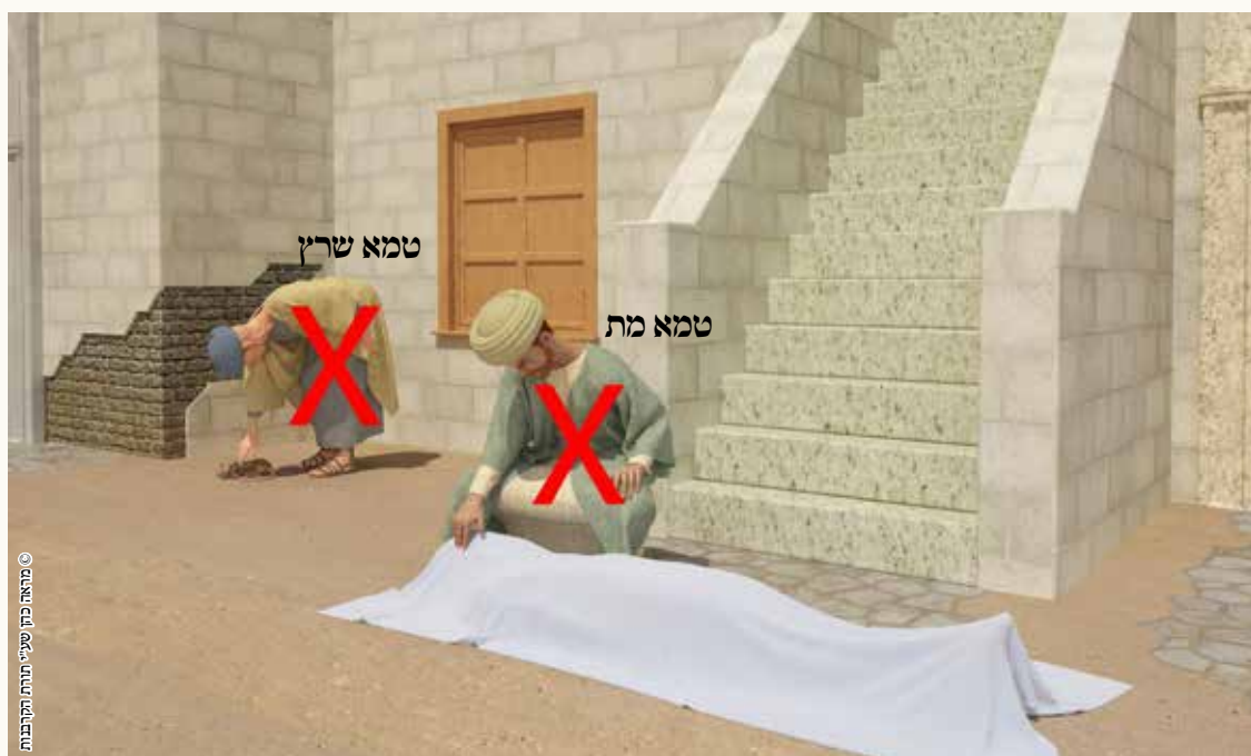
© מהאר כותב שיעור תורת התקנות

למסקנא פוסל בין טמא משרץ, ובין טמא ממת אף שטמא מת כשר בקרבן ציבור (ולא כזקני דרום).