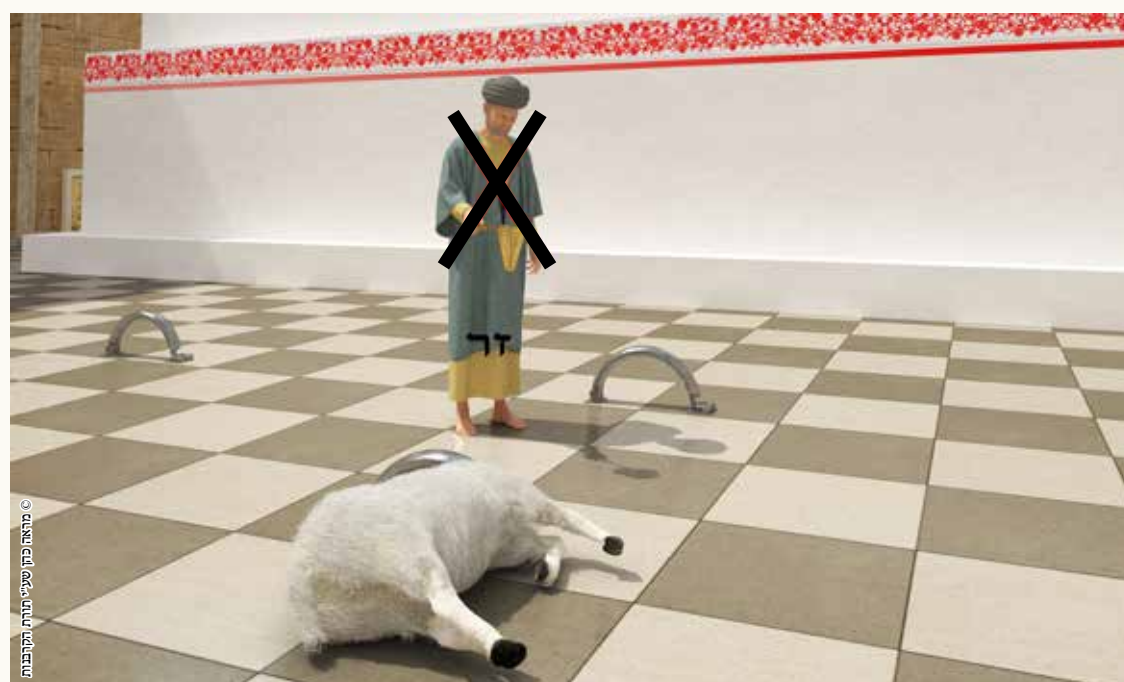
© מאת מרת שטיינר תורת הקבלות

טו: 'כל הזבחים שקיבלו דמן ... זר פסל'. קבלה היא עבודה, וצריך דוקא כהן כשר.