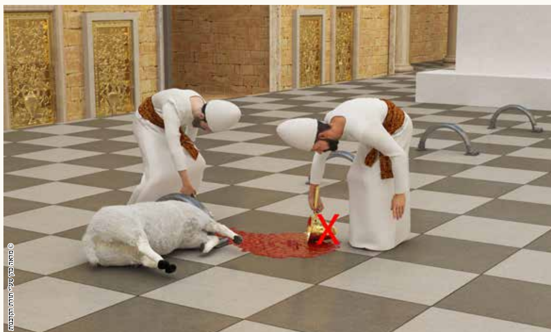
© מאת פתח שערי תורתו הקולנועית

אם נשפך הדם מצואר הבהמה לרצפת העזרה, הדם פסול מלזרוקו על המזבח.