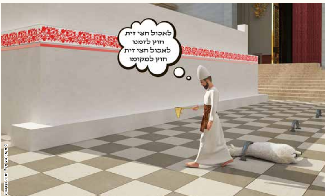
© מאת פת שיעורי תורת התקופות

מחלוקת רבא ורב המנונא האם החצי זית השני של חוץ לזמנו מצטרף עם החצי זית הראשון והפיגול חל, או לא מצטרף.