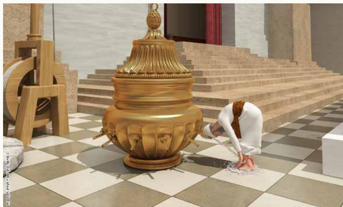
© מראה כהן שיעי תורת הקבלות

יט: 'ביצר מצוות קידוש: מניח ידו הימנית על גבי רגלו הימנית, וידו השמאלית על גבי רגלו השמאלית, ומקדש'.