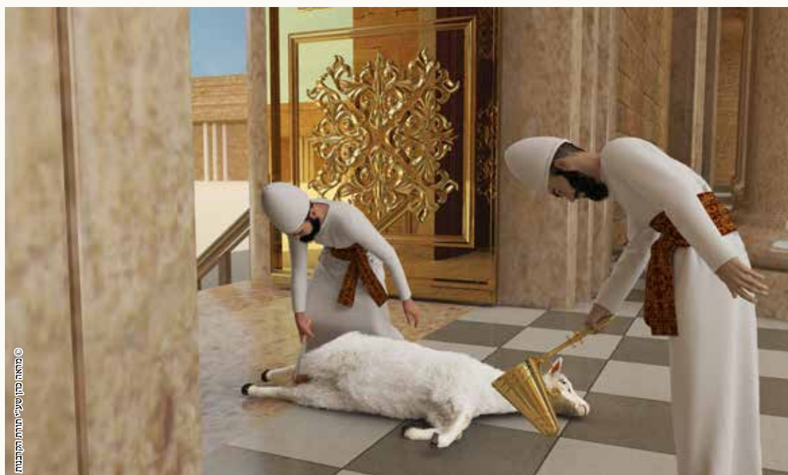
מראה כהן שחיטת התקנות ©

בהמה שהיו רגליה חוץ לעזרה בשעת השחיטה, צריך לחתוך את הבשר שבחוץ (עד העצם) לפני שמקבל את הדם, שלא יכנס דם פסול שנפסל ביציאה חוץ לעזרה.