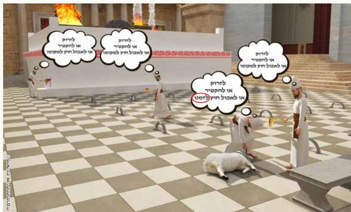
© מאת: כהן שני תורתו הקרבנות