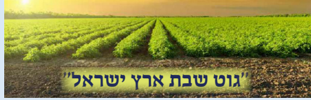
"גוט שבת ארץ ישראל"

גיבורי כח: אנו עומדים סמוך ונראה לשנת השמיטה תשפ"א. בשבת קודש פרשת ראה קראנו בתורה (דברים טו) את הציווי הנצחי: מִקֵּץ שִׁבְעַת שָׁנִים תַּעֲשֶׂה שְׁמִטָּה... קְרָבָה שְׁנַת הַשְּׁבַע שְׁנַת הַשְּׁמִטָּה... ידוע הסיפור על גאב"ד פובניץ ה'ג"ר יוסף שלמה כהנמן זצ"ל כאשר הגיע בערב ראש השנה של אחת משנות השמיטה לשוועל "חפץ חיים" ששמרו שמיטה בשדותיהם, עמד וקרא בקול בהתרגשות גדולה "גוט שבת ארץ ישראל".