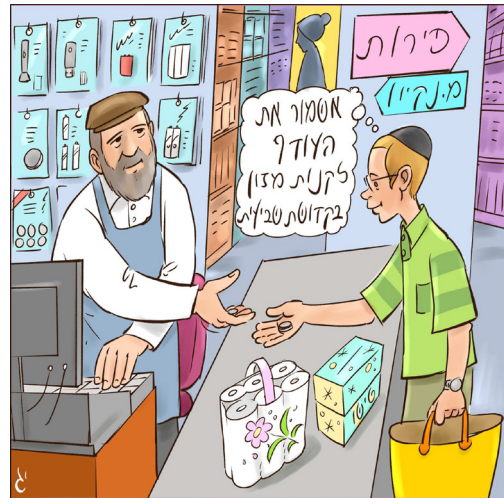
האיור מתוך ספר 'דרך השמיטה'

וכמובאר בברייתא "כיצד, לקח בפירות שביעית בשר, אלו ואלו מתבערים בשביעית. לקח בבשר דגים, יצא בשר ונכנסו דגים. לקח בדגים יין, יצאו דגים ונכנסו יין. לקח ביין שמן, יצא יין ונכנסו שמן. הא כיצד, אחרון אחרון נתפס בשביעית ופרי עצמו אסור."