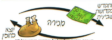
האיור מתוך גיליון 'כל מקדש שביעית' 17