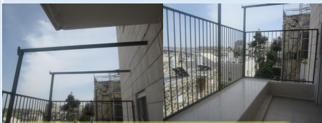
מדרגה בדופן הסוכה ומרפסת חוצצת מעל חלק מהסוכה