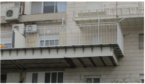
מרפסת רגילה עם מדרגה בצורת 'למד' וחלק מהמרפסת מקורה על ידי מרפסת מהקומה מעל