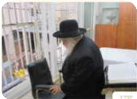
הגר"ח קניבסקי זצ"ל באמירת בואי בשלום נעמד בחלון ביתו והופך פניו לכיוון מערב

אדם חשוב מגיע מהדלת: לדעת הערך השולחן (סימן רסב סעיף ה), הגר"ר ניסים קרליץ זצ"ל (חוט שני שבת חלק ד פרק פב עמוד ג), הגר"ר ישראל יעקב פישר זצ"ל (הליכות אבן ישראל שבת חלק א עמוד פא), הגר"ר יוסף ליברמן זצ"ל (משנת יוסף הלכות בית הכנסת סימן מא), הגר"ח בנימין יהושע זילבר זצ"ל (אז נדברו חלק ב סימן ו), הגר"ר משה שטרנבוך שליט"א (תשובות והנהגות כרך א סימן רפה), על פי הפשט עיקר הענין הוא להסתובב לכיוון צד הפתח, כקבלת פני המלך שמגיע דרך הפתח, ובודרך כלל באירופה היה ארון הקודש ופני בית הכנסת לצד מזרח, והיו מתפללים לכיוון מזרח, ודלת הכניסה היתה בצד מערב, ולכן הוזכר באחרונים שמתבובבים לצד מערב, ואין הכי נמי במקום