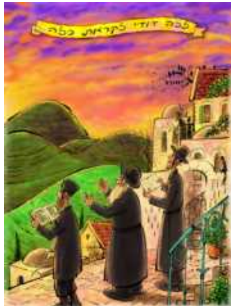
מצוירי יוני גרינשטיין

שאלה: לאיזה כיוון יש לפנות באמירת 'בואי בשלום' בקבלת שבת, צד מערב, צד הפתח, צד הפוך ממה שמתפלל? כיצד ינהג מי שיושב בכותל המזרח של בית הכנסת שהרי פניו