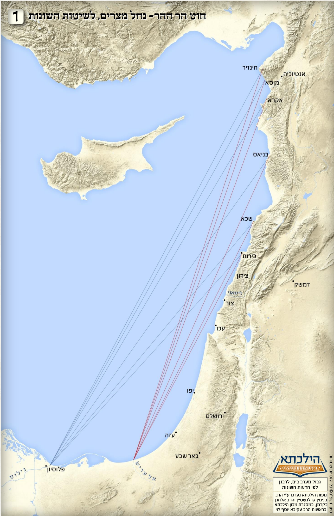
1 חוט הר ההר - נחל מצרים, לשיטות השונות

הדעות השונות בזיהוי של הר ההר יובאו להלן ובמפה 3, בקצרה ציין כי לזיהוי מקומו של הר ההר קיימות שש שיטות עיקריות, ולזיהוי מקומו של נחל מצרים קיימות שתי שיטות עיקריות. נטיית ציר הגבול של חוט מערב, מושפע מזיהוי המקומות.