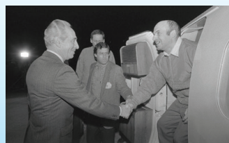
אנטולי שרנסקי, נפגש עם ראש הממשלה דאז שמעון פרס לאחר שחרור מברית המועצות

נתן שרנסקי נולד בתש"ח (1948) בברית המועצות בשם אנטולי בוריסוביץ. שרנסקי היה ציוני נלהב ועודד יהודים לעלות לארץ. בקשותיו שלו לקבל היתר עלייה נדחו מסיבות "ביטחוניות". הוא פעל לשמירה על זכויות אדם והפך לדוברם של אסירי ציון ומסורבי העלייה. בשנת תשל"ז (1977) נעצר והואשם בכגידה, ריגול והסתה. בית המשפט גזר עליו 13 שנות מאסר. שרנסקי שרד את קשיי המעצר ושמר על חירותו הנפשית בזכות דבקו בזהותו היהודית ותשוקתו לעלות לארץ. הוא הפך לסמל המאבק לשחרור יהודי ברית המועצות. לאחר מאבק ולחצים רבים החליטו השלטונות לשחררו במסגרת עסקה עם ישראל, ובשנת תשמ"ו (1986) השתחרר ועלה לארץ. שרנסקי כיהן כשר בממשלות ישראל, ומשמש כיו"ר הסוכנות היהודית.