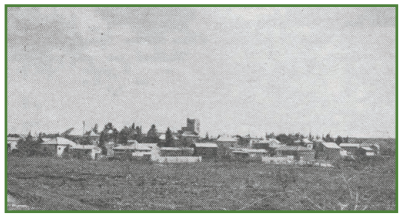
מושב עטרות, 1944 (Wikipedia)

עטרות היה מושב עובדים ששכן מצפון לירושלים, בסמוך לכפר הערבי קלנדיה ושדה התעופה עטרות. האדמות נרכשו על ידי החברה להכשרת היישוב, ובתחילה ישבה עליהן קבוצת קלנדיה, שהתקשתה להחזיק מעמד במקום והתפנתה. בשנת תרע"ט (1919) התיישבה במקום קבוצת עבודה והקימה בו יישוב תוך תנאים קשים, מחסור במים והתקפות מצד השכנים הערבים. בשיאו מנה היישוב 48 משפחות. במהלך מלחמת העצמאות הותקף היישוב המבודד, ולאחר כישלונה של שיירת עטרות לפרוץ אליו, נטשו אותו התושבים והוא נשרף בידי הערבים. מפוני היישוב הקימו באזור יהוד את המושב "בני עטרות" , הנקרא על שם היישוב הקודם.