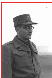
אלוף דוד שאלתיאל

האלוף דוד שאלתיאל ז"ל היה מפקד שירות הידיעות של ההגנה, מפקד חטיבת עציני ואלוף בצה"ל. שאלתיאל נולד בגרמניה ובשנת תרפ"ג (1923) עלה לארץ, עבד כפועל חקלאי והצטרף להגנה ושירת בלגיון הזרים הצרפתי כדי לרכוש ניסיון צבאי. בשנת תרצ"ה (1935) נשלח לאירופה למטרות רכש, נתפס על ידי הנאצים ונכלא למשך 8 חודשים במחנות הריכוז בדכאו ובבונוואלד. לאחר שובו לארץ פיקד על שירות הידיעות של ההגנה, הש"י, והיה מפקד מחוז ירושלים. במלחמת העצמאות התמנה למפקד חטיבת עציני וניהל את המערכה על ירושלים. שאלתיאל הקים את חיל הספר, שהפך לאחר מכן למשמר הגבול, והיה מפקדו הראשון. אחרי שחרורו מצה"ל כיהן כשגריר במספר מדינות.