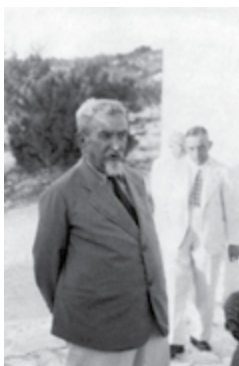
דר הלל יפה

ד"ר הלל יפה היה רופא המושבות בתקופת העלייה הראשונה. יפה נולד באוקראינה ולמד רפואה בז'נבה ובפריז. בשנת תרנ"א (1891) עלה לארץ. בשנת תרנ"ה (1895) התמנה לנציג "חובבי ציון" בארץ ישראל, והחל לשלב בין עבודתו כרופא לפעילות ציבורית. הוא פעל רבות למלחמה במחלת המלריה שעשתה שמות בקרב המתיישבים, גייס כספים לייבוש הביצה שליד חדרה ולמטרות נוספות, והדריך את היישוב כדי לעצור את התפשטות מגיפת החולירע ב-תרס"ב (1902). יפה עבד בבית החולים בחיפה ולאחר מכן ניהל את בית החולים בזכרון יעקב.