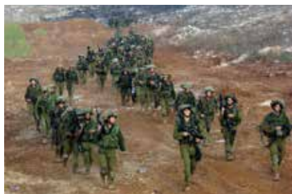
חיילים מחטיבת הנח"ל צועדים בחזרה מלבנון לאחר הפסקת האש

בקיץ שנת תשס"ה (2006) התנהלה במשך 34 ימים מלחמה בין ישראל לחיזבאללה. המלחמה החלה לאחר שהחיזבאללה הרגו 3 חיילי צה"ל וחטפו שניים נוספים. לאור זאת החלה ישראל לתקוף את כוחות החיזבאללה בעיקר בדרום לבנון, ואלו בתגובה ירו טילים לעבר מטרות ויישובים בעיקר בצפון הארץ. במהלך המלחמה נהרגו 44 אזרחים ו-121 חיילים, ונפצעו 2,000 אזרחים ו-628 חיילים. המלחמה הסתיימה ב-14 באוגוסט 2006, בהסכם הפסקת אש, וכתוצאה מכך נערך צה"ל בהערכות חדשה מול לבנון.