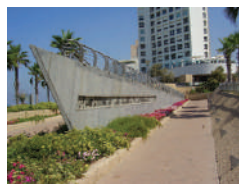
אנדרטת ההעפלה בגן לונדון בתל אביב

בין השנים 1922-1948 הגבילו השלטונות הבריטים את העלייה לארץ ישראל. יהודים רבים עלו לארץ בצורה בלתי חוקית, שכונתה "העפלה". ביניהם היו יהודים רבים בני עדות המזרח, שחלקם הגיעו מארצות ערב וחלקם עלו דרך אירופה. רוב העולים הגיעו בקבוצות קטנות, שהובלו בידי מבריחים ערבים. הם נקלטו בארץ בכפר גלעדי ומשם פוזרו ביישובים שונים. בהמשך מינתה הנהגת היישוב את המוסד לעלייה ב' להיות אחראי על ארגון ההעפלה מארצות ערב. חלק מהמעפילים הגיעו דרך היבשה וחלקם בספינות דרך הים. מעריכים שכ-12,000 יהודים עלו לארץ בצורה זו.