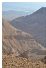
תצפית אל נחל חבר, מעלה היצירה

נחל חבר הוא נחל במדבר יהודה הזורם מאזור יטא ונשפך לים המלח. אורכו של הנחל כ-17 ק"מ. בנחל יש מספר מפלים קטנים, ומפל גדול שגובהו למעלה מ-100 מטרים. הנחל נקרא על שם העיר חברון שהשתמר בשם הערבי "ואדי חברה". הוא נקרא גם ואדי אל חייאת - נחל הנחשים. במצוקי הנחל נמצאו שתי מערות ובהן ממצאים ארכאולוגיים חשובים: מערת האימה ומערת האגרות. במערות התגלו חפצים, מסמכים ושילדי אדם מתקופת מרד בר כוכבא. עצמות האנשים שנמצאו במערות נקברו בשנת תשמ"א (1981) על שפתו הצפונית של קניון הנחל בטקס צבאי מלא על ידי הרב שלמה גורן.