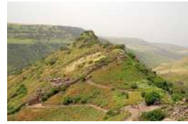
ההר שמזכיר בצורתו גמל, על שמו נקראה גמלא