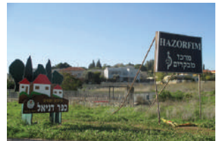
הכניסה לכפר דניאל