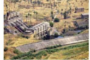
תחנת הכוח בנהריים

בשנת 1927 הקים פנחס רוטנברג את מפעל החשמל ההידרואלקטרי בנהריים, כחלק מתוכנית להקמת 13 תחנות כוח בארץ ישראל שייצרו חשמל באמצעות מים. במקום נבנתה תחנת הכוח, והוקמה מערכת של סכרים, תעלות ומאגרי מים, כדי להשתמש במים להפקת החשמל. זמן קצר לפני הפעלת התחנה ב-1931 התרחש במקום שיטפון גדול שגרם לנזק רב, אך הפועלים התנדבו לתקן אותו אפילו ללא תשלום, כדי להשלים את הקמת התחנה. המפעל נפתח רשמית ב-1932, והתחנה סיפקה חשמל בהיקף של 18 מגה וואט. עם מפעל זה כונה פנחס רוטנברג "הזקן מנהריים", משום שהיה מבוגר משאר העובדים.