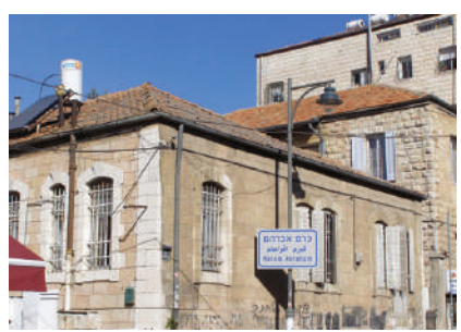
בתים בשכונת כרם אברהם (Wikipedia, ranbar)

הקונסול הבריטי בירושלים גיימס פין, שהיה נוצרי, דובר עברית וחובב תנ"ך, רכש את המקום בשנת 1852, והקים שם חווה חקלאית ברוח התנ"ך כדי להעסיק יהודים. כאשר פין עזב את הארץ בשנת 1863 הוא מכר את המקום לפועלים, והם הקימו שם את שכונת "כרם אברהם". המשוררת זלדה התגוררה בשכונה, וביתה ברחוב צפניה 31, משמש מקום ביקור בסטיורים בירושלים.