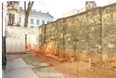
החלק האחרון של חומות גטו בודפשט, שנהרס בשנת 2006

גטו בודפשט היה המקום בו רוכזו יהודי בודפשט והונגריה במהלך השואה. הנאצים פלשו להונגריה בשלב מאוחר של מלחמת העולם השנייה. הגטו הוקם בנובמבר 1944 והתקיים שלושה חודשים בלבד, עד שחרורו בידי הצבא האדום בינואר 1945. הגטו מוקם סביב בית הכנסת הגדול וכלל כמה גושי בניינים שהוקפו בגדר. בתוכו רוכזו כ-200,000 יהודים. לא ניתן היה להיכנס אליו או לצאת ממנו, ותושבי הגטו סבלו מצפיפות, רעב ומחלות כגון טיפוס. יותר ממחצית היהודים בגטו נשלחו להשמדה, ובשעת שחרורו נותרו בו כ-70,000 איש.