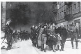
מורדי הגטו מובלים על ידי חיילים, מאי 1943

גטו ורשה הפך לסמל לגבורה והתקוממות כנגד כל הסיכויים.