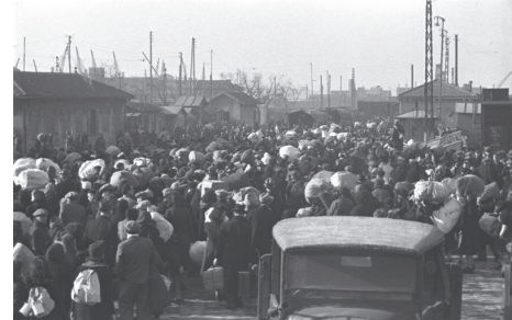
יהודים מגורשים ממרסיי 1943

היהודים שחיו בצרפת בימי ביניים סבלו מאנטישמיות קשה, וגורשו מהארץ פעם אחר פעם. הגירוש הראשון נעשה על ידי המלך פיליפ השני בשנת 1182, ולאחר 16 שנה הותר ליהודים לשוב. לאחר מכן היו גירושים מקומיים בשנים 1270 ו-1289. בשנת 1306 הוציא המלך פיליפ הרביעי צו גירוש לכל יהודי צרפת. כל רכושם הופקע מהם, והם נאלצו לעזוב בחוסר כל. במהלך המאה ה-14 נעשו ניסיונות על ידי שליטים אחרים להחזיר חלק מהיהודים לצרפת, אך בסופו של דבר נגזרו בכל פעם גזירות גירוש חדשות. בשנת 1395 גורשו באופן סופי כל יהודי צרפת, ולאחר מכן גם יהודי פרובנס. רק בתקופת הרנסנס החלו יהודים להתיישב מחדש בצרפת.