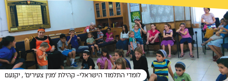
לומדי התלמוד הישראלי - קהילת 'מנין צעירים', יקנעם

כל קהילה שתצטרף, תקבל את העלון השבועי עפ"י הכמות הנצרכת בקהילתה בחינם עד פתח הבית! לרישום סרקו את הקוד.