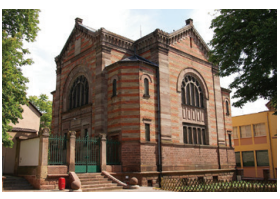
בית כנסת באלזס

חבל אלזס נמצא בגבולה המזרחי של צרפת, על הגדה המערבית של הריין. באזור התקיימה קהילה יהודית ותיקה, שראשיתה במאה ה-5 לספירה. יהודים אלה עסקו בעיקר ברפואה, הלוואות בריבית ורוכלות. הם היו נתונים להגנתם של האצילים המקומיים, אבל סבלו פעמים רבות מפרעות, רציחות והלשנות. במהלך מגפת המוות השחור הואשמו היהודים באלזס, כמו בכל אירופה, בהרעלת בארות והפצת המגיפה, וקהילות יהודיות רבות נטבחו או גורשו. במאה ה-14 גורשו כל היהודים מצרפת, והחלו לשוב בהדרגה במאה ה-16. הקהילה היהודית שם הלכה וגדלה, ורובה שרדה אף את השואה. כיום גרים בעיר שטרסבורג, בירת האזור, כ-15,000 יהודים.