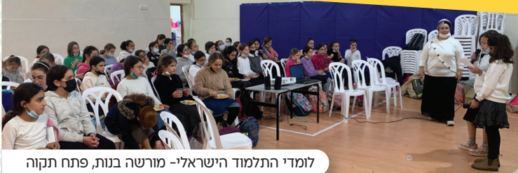
לומדי התלמוד הישראלי- מורשה בנות, פתח תקוה

כל קהילה שתצטרף, תקבל את העלון השבועי עפ"י הכמות הנצרכת בקהילתה בחינם עד פתח הבית! לרישום סרקו את הקוד.