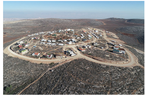
היישוב אש קודש ממעוף הציבור