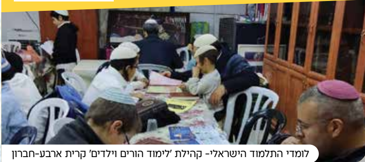
לומדי התלמוד הישראלי- קהילת 'לימוד הורים וילדים' קרית ארבע-חברון

כל קהילה שתצטרף, תקבל את העלון השבועי עפ"י הכמות הנצרכת בקהילתה בחינם עד פתח הבית! לרישום סרקו את הקוד.