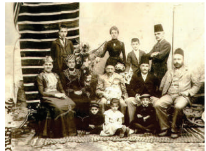
משפחה יהודית ספרדית בסרייבו בשלהי המאה ה-19

סרייבו היא עיר הבירה של מדינת בוסניה והרצגובינה. יהודים התיישבו בעיר במאה ה-16 והקימו בה את הרובע היהודי. במאה ה-17 הגיעו לעיר פליטים מקהילות אשכנז שהקימו בה קהילה נפרדת. במאה ה-19 נהנו יהודי סרייבו מפריחה כלכלית ותרבותית והתיישבו בה משפחות נכבדות. אחרי מלחמת העולם הראשונה הייתה קהילת סרייבו השלישית בגודלה ביוגוסלביה. במהלך מלחמת העולם השנייה השתלטו הנאצים על העיר, וכ-6,600 מתוך 9,000 היהודים שבה נרצחו. הקהילה היהודית בעיר התחדשה אחרי המלחמה. רבים מבני הקהילה עזבו את העיר בעקבות מלחמת בוסניה, וכיום גרים בה כמה מאות יהודים.