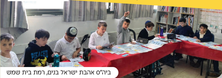
ביה"ס אהבת ישראל בנים, רמת בית שמש

כל קהילה שתצטרף, תקבל את העלון השבועי עפ"י הכמות הנצרכת בקהילתה בחינם עד פתח הבית! לרישום סרקו את הקוד.