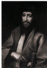
הרב צבי הירש אשכנזי, "החכם צבי"

רבה הראשון של קהילת יהודי סרייבו היה הרב שמואל ברוך מסלוניקי, שהתמנה לתפקידו בשנת 1623. בשנת 1686 התמנה לראש הקהילה הספרדית הרב צבי הירש אשכנזי, אשר כונה "החכם צבי", והכיר את שיטת הלימוד והפסיקה הספרדית למרות מוצאו ממזרח אירופה. הוא כיהן בתפקידו עד 1689, ואחריו התמנה הרב יצחק צבי. בשנת 1697 נפלו הרב וכמה מנכבדי הקהילה בשבי, ושחררו רק לאחר תשלום כופר נפש נכבד. בשנת 1716 החליף את הרב יצחק צבי בנו, הרב שם טוב בן יצחק צבי, שכיהן עד 1732. רבנים נוספים שכיהנו בקהילת סרייבו היו הרב יוסף מג'ורו, הרב דוד פארדו, הרב משה דאנון והרב משה פירירה, שקיבל מהשלטונות העות'מאניים את התואר "חכם באשי".