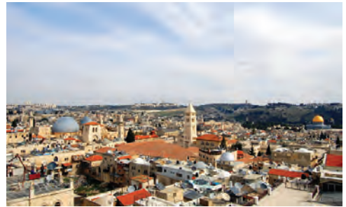
העיר העתיקה בירושלים (Wikipedia, אני)

העיר העתיקה בירושלים היא האזור העתיק של העיר. היא נבנתה בתקופה הכנענית, ודוד המלך הפך אותה לבירתו. בתחומה נמצא הר הבית, עליו עמדו בית המקדש הראשון והשני. העיר העתיקה מחולקת לארבעה רבעים - היהודי, המוסלמי, הארמני והנוצרי, ושמונה שערים נמצאים בחומותיה. היא נבנתה ונהרסה לסירוגין במשך אלפיים שנה, ונמצאים בה שרידים של מבנים רבים מתקופות קדומות. במלחמת העצמאות השתלטו הירדנים על העיר, אולם היא שוחררה מחדש בידי ישראל במלחמת ששת הימים. כיום גרים בעיר העתיקה כ-39,000 תושבים, מתוכם כ-3,000 יהודים.