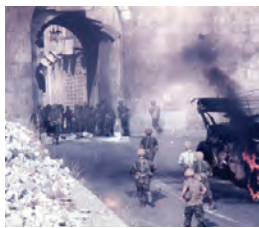
פריצת כוחות צה"ל אל העיר העתיקה בירושלים דרך שער האריות במלחמת ששת הימים

מלחמת ששת הימים התנהלה בין ישראל למצרים, סוריה וירדן מכל"ו אייר עד ב' סיון תשכ"ז (1967). לאחר תקופת המתנה מתוחה, בה אימו מדינות ערב להשמיד את ישראל, נפתחה המלחמה בהתקפת פתע של חיל האוויר הישראלי שהצליחה להשמיד את רוב חילות האוויר של האויב. בכך זכתה ישראל ליתרון משמעותי, ובמהלך המלחמה הביסה את צבאות ערב וכבשה את יהודה, שומרון, רצועת עזה, ירושלים המזרחית, רמת הגולן וסיני, כשהיא מגדילה בכך את שטחה פי שלוש. הניצחון הגדול ושחרורם של חלקים נרחבים מארץ ישראל עוררו תחושת התלהבות גדולה בישראל