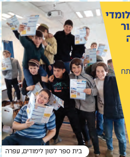
בית ספר לשון לימודים, עפרה

אם גם אתם נתקלתם בדילמה ו'התפללתם' עליה אתם מוזמנים לשתף אותנו ונפרסם אותה אצלנו בעלון. ניתן לשלוח למייל talmudisraeli@medison.co.il תחת הנושא "דילמה" עם שם משפחה ועיר מגורים וגם אתם תיכנסו להגרלה על פרסים שווים