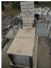
קברו של ר' ישראל משקלוב בבית הקברות הישן בטבריה

עליית תלמידי הגר"א הייתה עלייה של קבוצות יהודים מליטא במהלך המאה ה-19, שנקראה כך משום שחלקם היו תלמידיו של הגר"א ושל משנתו. העולים הגיעו בשלושה גלים, שבראשם עמדו ר' מנחם מנדל משקלוב, ר' סעדיה משקלוב, הרב חיים כ"ץ ור' ישראל משקלוב. סך הכל הגיעו לארץ כמה מאות עולים, שהתיישבו בתחילה בטבריה ולאחר מכן בצפת ובירושלים. תלמידי הגר"א, שכוננו "פרושים", ייסדו את כולל וילנא בירושלים והתפרנסו מכספי החלוקה שהגיעו מחו"ל. הם לקחו חלק חשוב בחיזוק היישוב היהודי בעיר העתיקה, וכן בהקמת השכונות מחוץ לחומות וברכישת אדמות נבי סמואל ופתח תקווה.