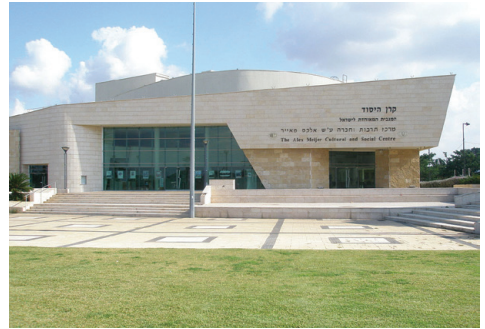
מרכז תרבות וחברה באור עקיבא

אור עקיבא היא עיר במחוז חיפה, שהוקמה ב-1951 על ידי קבוצת עולים מרומניה, ונקראה בתחילה מעברת חוף הכרמל או מעברת קיסריה. שנתיים לאחר מכן שונה שם היישוב לאור עקיבא, על שם ר' עקיבא שהוצא להורג בקיסריה הסמוכה. עולים רבים מארצות שונות התיישבו במקום לאורך השנים. גל עלייה גדול במיוחד הגיע מברית המועצות בשנת 1992, והביא להקמת שכונות חדשות ושירותים ציבוריים נוספים. כיום גרים במקום כ-18,000 תושבים. עזר ויצמן שהיה מקורב מאוד לתושבי אור עקיבא, ביקש שלא להיקבר בחלקת גדולי האומה בהר הרצל בירושלים, אלא להיקבר בבית הקברות באור עקיבא, ליד קבר בנו שאול