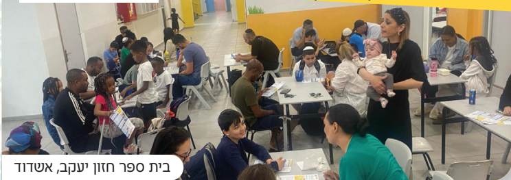
בית ספר חזון יעקב, אשדוד

כל קהילה שתצטרף, תקבל את העלון השבועי עפ"י הכמות הנצרכת בקהילתה בחינם עד פתח הבית! לרישום סרקו את הקוד.