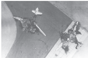
שני מפציצים מצריים שהושמדו על הקרקע

חיל האוויר הישראלי מילא תפקיד מכריע במלחמת ששת הימים. באותו זמן עמדו לרשותו 203 מטוסי קרב. המלחמה נפתחה בהתקפת פתע נרחבת של חיל האוויר הישראלי על בסיסי חילות האוויר של מדינות ערב, במסגרת "מבצע מוקד". רוב מטוסי האויב הושמדו או שותקו, ובכך למעשה הוכרעה המלחמה כבר בתחילתה. 451 מתוך 600 המטוסים שהיו למדינות ערב הושמדו במהלך המלחמה. השליטה האווירית שהושגה אפשרה לחיל האוויר להגיש סיוע לכוחות היבשה הישראליים, לתקוף כוחות שריון וארטילריה של צבאות ערב ולזרז את תבוסתם. 25 טייסים ישראליים נהרגו במלחמה.