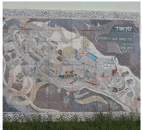
פסיפס על קיר חדר האוכל המציג את מפת הכפר

ימין אורד הוא כפר נוער פנימייתי ליד הכרמל. הוא נקרא על שם אורד וינגייט, הקצין הבריטי שסייע להגנת היישוב היהודי. היישוב נוסד ב-1953 ונקרא בתחילה כפר וינגייט. בשנת 2000 הוקמה בו המכינה הקדם-צבאית ימין אורד. במהלך השריפה בכרמל ב-2010 התפנו תושבי הכפר, ורבים מהמבנים שבו נפגעו. בכפר מתגוררים ומתחנכים כ-500 בני נוער עולים חדשים ממדינות שונות.