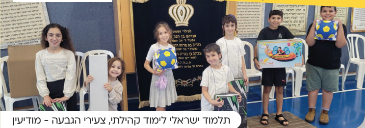
תלמוד ישראלי לימוד קהילתי, צעירי הנבעה - מודיעין

כל קהילה שתצטרף, תקבל את העלון השבועי עפ"י הכמות הנצרכת בקהילתה בחינם עד פתח הבית! לרישום סרקו את הקוד.