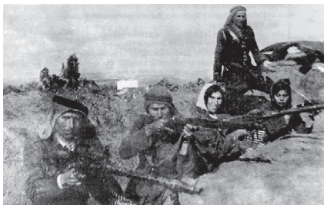
לוחמי כנופיות ערביות בתקופת המרד הערבי הגדול (1936) (Wikipedia, hanini)

המרד הערבי הגדול, המכונה גם מאורעות תרצ"ו-תרצ"ט, היה מרד מאורגן שפרץ בארץ בשנת תרצ"ו. מטרת הערבים במרד היו למנוע הקמת מדינה יהודית, לפגוע בהתיישבות ולשכנע את הבריטים לקבל את דרישות הציבור הערבי. במהלך המרד תקפו הערבים יישובים יהודים, מוסדות בריטים ונציגי שלטון, ובנוסף לכך הכריזו על שביתה כללית כדי לפגוע במשק. למעלה מ-400 יהודים נרצחו במאורעות, ומספר יישובים קטנים נחרבו או ננטשו. המרד לא השיג את מטרתו, ובסופו של דבר גרם יותר נזק לערבים מאשר ליישוב היהודי, שהמשיך לגדול ולהתחזק.