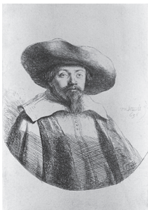
דיוקן של הרב מנשה בן ישראל (Wikipedia, רמברנדט)

בשנת 1290 פרסם מלך אנגליה, אדוארד הראשון, צו האוסר על יהודים להתגורר בתחומה של הממלכה האנגלית. לצו הזה קדמו גזירות שונות נגד היהודים, עלילות דם ופוגרומים. צו הגירוש נחתם בתשעה באב, ונאמר בו שעל היהודים לעזוב את המדינה עד הרביעי בנובמבר, ומי שישאר שם לאחר מכן יוצא להורג. אלפי יהודי אנגליה נאלצו לעזוב את בתיהם, והיגרו בעיקר להולנד, צרפת וספרד הסמוכות. חלק מהיהודים שעזבו בספינה ננטשו על שרטון והושארו שם למות. רק במאה ה-17 הותר ליהודים לחזור לאנגליה, בעקבות השתדלותו של הרב מנשה בן ישראל, אם כי צו הגירוש לא בוטל באופן רשמי עד היום.