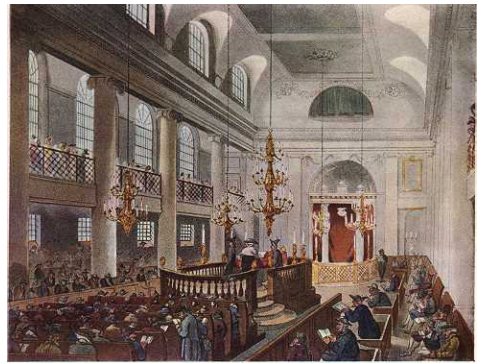
ציור של בית הכנסת הגדול בלונדון, 1810 (Wikipedia, Thomas Rowlandson)

יהודים התיישבו לראשונה באנגליה במהלך המאה ה-11. הם עסקו בעיקר בבנקאות, ובאותה תקופה פעלו שם כמה מבעלי התוספות. במאה ה-13 הורע יחס השלטונות כלפיהם, התרחשו פרעות ורדיפות, וב-1290 גורשו בצו המלך כל יהודי אנגליה. רק בשנת 1655 הורשו לחזור אליה והתיישבו בה מחדש. מצבם השתפר בהתמדה, ובמאה ה-19 זכו לשוויון זכויות והגיעו לתפקידים בכירים ואף השתלבו בשלטון. כיום, הקהילה היהודית הגדולה באנגליה היא בלונדון, ובה חיים כ-200 אלף יהודים השייכים לזרמים שונים. הקהילה השנייה בגודלה נמצאת במנצ'סטר, עם 40 אלף יהודים.