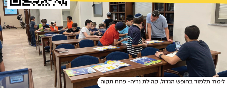
לימוד תלמוד בחופש הגדול, קהילת נריה - פתח תקוה

כל קהילה שתצטרף, תקבל את העלון השבועי עפ"י הכמות הנצרכת בקהילה בחינם עד פתח הבית! לרישום סרקו את הקוד.