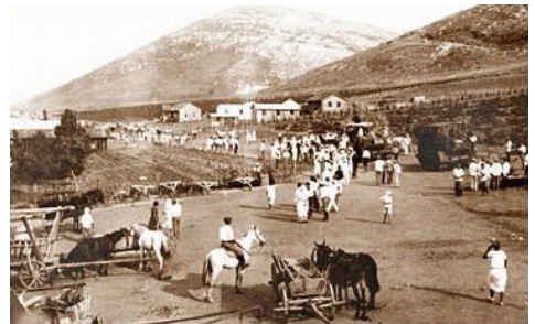
עין חרוד בראשית שנות העשרים (Wikipedia)

עין חרוד הוא הקיבוץ הראשון בארץ ישראל. הוא שוכן בעמק חרוד שבעמק יזרעאל. הקיבוץ הוקם בשנת 1921 על ידי חברי גדוד העבודה ואנשי השומר, ונקרא בתחילה "פלוגת גדוד העבודה בעמק יזרעאל". בשנת 1926 עבר הקיבוץ למקום הקבע שלו, בגבעת "קומי", מתחת לכפר הערבי שהיה בראש הגבעה. הרב קוק ביקר בקיבוץ בשנת 1927 במסגרת מסע הרבנים אל המושבות, כדי להשפיע על המתיישבים להתחזק בקיום המצוות. בשנת 1952 התפצל הקיבוץ לשני קיבוצים: עין חרוד מאוחד, ועין חרוד איחוד, וחילקו ביניהם את האדמות והרכוש בצורה שווה. כיום גרים בכל אחד מהם כמה מאות תושבים.