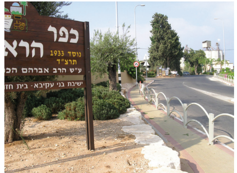
הכניסה לכפר הרא"ה

כפר הרא"ה הוא מושב דתי שנמצא בעמק חפר. המושב הוקם בשנת תרצ"ד (1933) על ידי עולים מאירופה, ונקרא על שם הרב אברהם יצחק הכהן קוק. בשנת ת"ש (1940) הקים הרב משה צבי נריה במקום את הישיבה התיכונית כפר הרא"ה, שנחשבת לאם הישיבות התיכוניות, ושילבה בין לימוד תורה לעבודת האדמה וללימודי חול. כיום גרים ביישוב כ-1,500 תושבים.