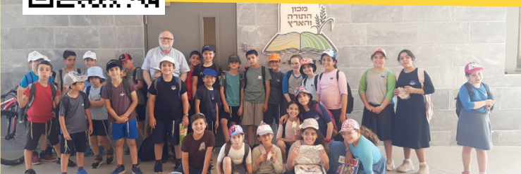
טיול סיום של מתמידי התלמוד הישראלי במשך השנה כולה - בית ספר מורשת מנחם גבעת שמואל

כל קהילה שתצטרף, תקבל את העלון השבועי עפ"י הכמות הנצרכת בקהילתה בחינם עד פתח הבית! לרישום סרקו את הקוד.