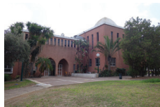
הבניין ההיסטורי של ישיבת בני עקיבא כפר הרא"ה