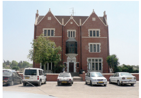
בניין 770 בכפר חב"ד

כפר חב"ד הוא יישוב באזור המרכז. הוא הוקם בשנת תש"ט על ידי קבוצת חסידי חב"ד שהתיישבו בכפר ערבי נטוש. במקביל התיישבו באזור עולים מהונגריה וצ'כוסלובקיה, שהקימו יישוב נפרד בשם "תוחלת". שני היישובים התאחדו בסופו של דבר. האדמו"ר מחב"ד, רבי יוסף יצחק שניאורסון, שלח למתיישבים מכתב עידוד וספר תורה. בשנת 1955 נקבע שם היישוב "כפר חב"ד", על שם החסידים שהקימו אותו. ביישוב הוקם בית ספר למלאכה, שהתפרסם בעקבות הפיגוע שנגעה בו ב-1956, בו נרצחו מדרך וחמישה ילדים. כיום גרים במקום כ-7,000 תושבים, והוא נחשב מוקד לפעילות חב"ד ברחבי הארץ.