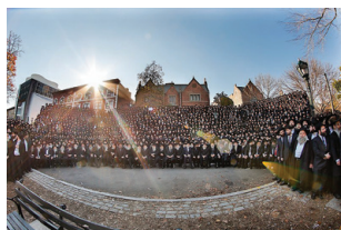
תמונה משותפת של שלוחי הרבי מליובאוויטש בחזית מרכז חב"ד העולמי - 770 בזמן כינוס השלוחים העולמי בשנת תשע"ו-2015

חסידות חב"ד נוסדה על ידי רבי שניאור זלמן מלאדי, המכונה "האדמו"ר הזקן" ו"בעל התניא", במזרח אירופה בסוף המאה ה-18. רבי שניאור זלמן היה תלמידו של המגיד ממזריטש, ממשיך דרכו של הבעל שם טוב, שרבים מתלמידיו ייסדו חסידויות משל עצמם. התנועה שהקים נקראה חב"ד - ראשי תיבות: חוכמה, בינה, דעת. חסידות חב"ד נתקלה בהתנגדויות, שבעקבותיהן נאסר האדמו"ר הזקן פעמיים בידי השלטונות ברוסיה, אך זכה לצאת לחופשי. שושלת אדמו"רי חב"ד מנתה שבעה "נשיאים", שהאחרון בהם היה הרבי מלובביץ'.