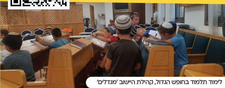
לימוד תלמוד בחופש הגדול, קהילת היישוב 'מגדלים'

כל קהילה שתצטרף, תקבל את העלון השבועי עפ"י הכמות הנצרכת בקהילתה בחינם עד פתח הבית! לרישום סרקו את הקוד.