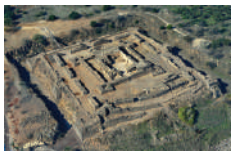
כוכב הירדן- כוכב הרוחות

כוכב הרוחות הוא אתר ארכיאולוגי בגליל התחתון. הוא נקרא גם כוכב הירדן ויפה נוף. במקום נמצאים שרידים של היישוב "כוכב" מתקופת התלמוד, ביניהם בית כנסת ואבנים עם סמל המנורה, ושרידיה של מצודה צלבנית שנבנתה במאה ה-12. במאה ה-18 נבנה במקום כפר בדואי, שנכבש במלחמת העצמאות. המקום נקרא כך על שם הרוחות החזקות הנושבות בו, וכונה על ידי הצלבנים "יפה נוף" בשל הנוף המרהיב