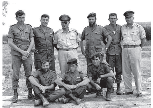
מאיר הר-ציון עומד ראשון משמאל, לצד אריאל שרון ומשה דיין, לאחר פעולת התגמול בכנתיילה, אוקטובר 1955

בשנות החמישים והשישים של המאה ה-20 נקטה ישראל לפיגועי טרור והתקפות מצד הערבים. את הפעולות הובילו ראש הממשלה דוד בן גוריון והרמטכ"ל משה דיין. התפיסה מאחוריהן היתה שלא ניתן למנוע כל פיגוע טרור, אבל אפשר לגבות מהאויב מחיר כבד עבור דם יהודי, שיבהיר לו שמעשים כאלה יעלו לו ביוקר. לשם ביצוע פעולות התגמול הוקמה יחידה 101, שהתמזגה בהמשך עם הצנחנים, אך גם כוחות צבא אחרים לקחו בהן חלק. בין פעולות התגמול הידועות היו פעולת קיביה, מבצע חץ שחור, מבצע אלקיים, מבצע לזלב ופעולת סמוע.