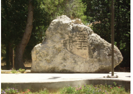
האנדרטה לחללי מלחמת העצמאות בכפר אחים, בראש הרשימה צבי ואפרים גובר

כפר אחים הוא מושב סמוך לקריית מלאכי. הוא הוקם בשנת 1949 על ידי עולים ממזרח אירופה בסמוך לחורבות הכפר הערבי קסטינה, ונקרא בתחילה קסטינה א' ויחיאל. בהמשך שונה שמו לכפר אחים, על שם האחים אפרים וצבי גובר ממושב כפר ורבורג הסמוך, שנפלו שניהם במלחמת העצמאות. בתחילה הוקם היישוב על שטח המחנה הבריטי הסמוך לקסטינה, אולם בהמשך הוקמה שם מעברה, והמשק החקלאי לא השתלב איתה. והמתיישבים עברו לכפר חקלאי שהוקם בסמוך לשם במימון ממשלת שוודיה, שביקשה להקים יישוב לניצולי שואה. כיום גרים במושב כ-900 תושבים.