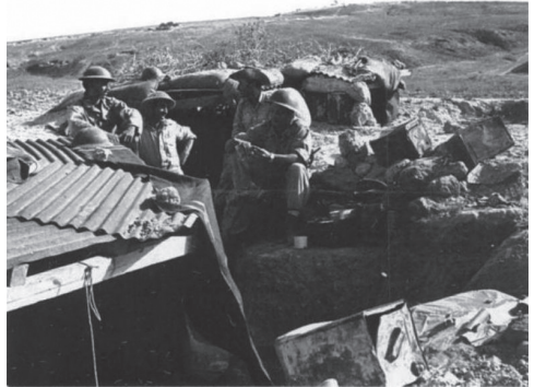
חיילי גבעתי במשלטי חוליקאת אחרי כיבושם במבצע יואב

משלטי חוליקאת היו עמדות שהחזיק הצבא המצרי על גבעות במישור החוף הדרומי. לעמדות אלה הייתה חשיבות רבה, משום שהן אפשרו לצבא המצרי לנתק את הנגב ודרום מישור החוף משאר המדינה. במלחמת העצמאות התחוללו מספר קרבות קשים סביב משלטים אלה. במבצע ברק השתלטו חיילי צה"ל על האיזור, אולם נהדפו ממנו בהמשך בהתקפת פתע מצרית. במהלך מבצע "מוות לפולט" נעשה ניסיון להשתלט שוב על המשלטים, שהסתיים בכישלון ובאבידות כבדות. רק במהלך מבצע יואב הצליח צה"ל לכבוש את האזור בקרב שנחשב לאחד הנצחונות הגדולים במלחמת העצמאות, אם כי גם הוא עלה במחיר כבד. 63 הלוחמים שנפלו בקרבות חוליקאת מונצחים באנדרטאות באזור. אחד מהנופלים היה צבי גובר הי"ד שהיה בן 17 במוות.