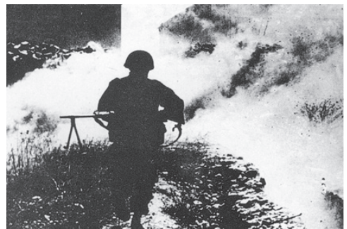
לוחם צה"ל בעת הקרב על גבעת התחמושת