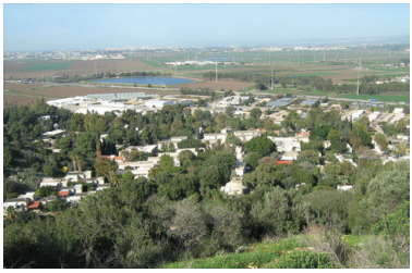
(מראה קיבוץ יגור מהכרמל)

קיבוץ יגור נמצא ממזרח להר הכרמל, דרומית מזרחית לחיפה. הוא נוסד בשנת 1922 על אדמות שקנה יהושע חנקין, ונקרא כך בהשפעת הכפר הערבי הסמוך יאג'ור. המתיישבים יישבו את הביצות של נחל קישון והכשירו את הקרקע לחקלאות, ובהמשך הוקמו מפעלים במקום. בימי המאבק בשלטון הבריטי היה קיבוץ יגור מרכז חשוב של ההגנה, והסתיר סליק שבו כלי נשק רבים, אותו גילו הבריטים במהלך "השבת השחורה". כיום גרים בקיבוץ יגור כ-1,600 תושבים, העובדים במשק ובמפעלים.