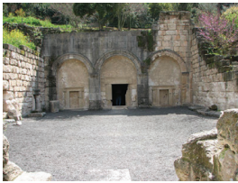
מערות הארונות בבית שערים

בית שערים היה יישוב יהודי חשוב בגליל התחתון בתקופת המשנה והתלמוד, והיה מקום מושבו של רבי יהודה הנשיא. בעקבות רבי הגיעה למקום גם הסנהדרין, והיישוב גדל והתפתח. לאחר מותו נקבר רבי באחוזת קבר משפחתית שבנה במקום. היישוב נחרב כנראה במאה ה-4 לספירה, והתגלה בחפירות ארכאולוגיות במהלך המאה ה-20. במקום נמצאו שרידי מבנים רבים, שכללו בית בד, בית כנסת ובית מדרש. כמו כן נמצאו מערות קברים רבות שבהם נקברו יהודים מרחבי הארץ ואף מחוצה לה. בשנת 2015 הוכרז המקום כאתר מורשת עולמי.