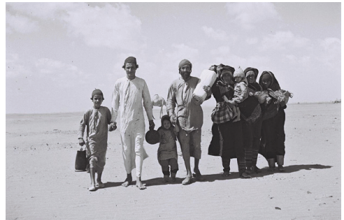
נובמבר 1949. משפחה תימנית בדרכה למחנה המעבר של הג'ניט ליד עזן.

בעקבות המהומות נגד היהודים שפרצו בתימן, יזמה ממשלת ישראל את מבצע "על כנפי נשרים", שבמהלכו הועלו לארץ כ-50,000 עולים באמצעות מטוסים. מבצע עלייה נוסף התקיים בין השנים 1952-1954.