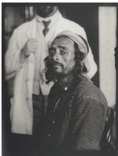
(בין השנים 1906-1918) תצלום של צעיר יהודי בתימן