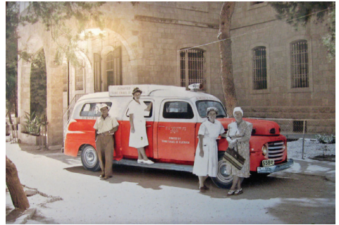
תמונה משנות ה-30 של אמבולנס, בחזית בניין שערי צדק הישן

כאשר נוסד בית החולים נקבע שהוא יתנהל על פי ההלכה, ועל כך מקפידים עד היום. בשנת 1980 עבר בית החולים לקמפוס חדש שבנה בשכונת בית וגן, והפך ממוסד קטן למרכז רפואי רב תחומי.