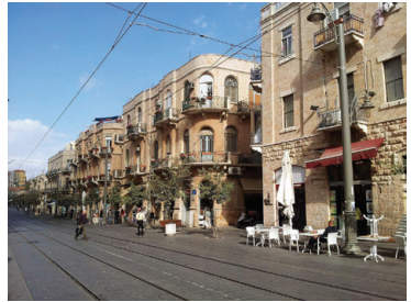
רחוב יפו בירושלים

רחוב יפו הוא רחוב מרכזי בירושלים. הוא מתחיל בשער יפו שבעיר העתיקה, וחוצה את העיר ממזרח למערב. ראשיתו של הרחוב הייתה בדרך יפו, שהובילה בתקופה העות'מאנית מיפו לירושלים. כאשר גדלה העיר והתפתחה נבנו לצדי הרחוב השכונות החדשות שמחוץ לחומות.