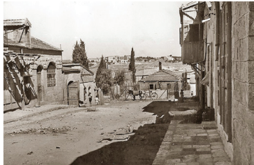
נחלת אחים ב-1937

נחלת אחים היא שכונה במרכז העיר החדשה בירושלים. היא נוסדה בשנת 1924 בידי יהודים שעלו מתימן, ונקראה כך בשל שאיפתם לחיי אחווה במקום. רחובות השכונה נקראו ברובם על שם ערים בישראל. רוב התושבים בשכונה היו בתחילה אורפלים - יהודים יוצאי