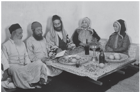
משפחה תימנית קוראת מזמורי תהלים סביב שולחן האוכל, לאחר ארוחת צהריים בשבת