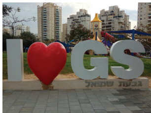
פארק רמון גבעת שמואל

גבעת שמואל היא עיר במחוז המרכז. היא הוקמה בשנות ה-40 על אדמות ממזרח בני ברק, ונקרא על שם המנהיג הציוני שמואל פינלס. ראשוני המתישבים במקום היו עולים מרומניה, הונגריה ובולגריה. בהמשך הפכה גבעת שמואל למועצה מקומית, קלטה עולים רבים מארצות שונות, ובשנת 2007 הוכרזה כעיר. בגבעת שמואל קיימת קהילה דתית-לאומית גדולה, ופועלים בה בתי כנסת ושיעורי תורה רבים. כיום גרים בה כ-28,000 תושבים. בין שכונות העיר: רמת אילן, גבעת יהודה, רמת הדר, שכונת גיורא ורמת הדקלים.