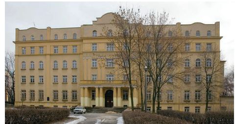
בניין ישיבת חכמי לובלין 2010

ישיבת חכמי לובלין הוקמה על ידי הרב מאיר שפירא זצ"ל, כדי להוות מקום משמעותי ללימוד תורה ולגידול דור של תלמידי חכמים. הישיבה הוקמה בעיר לובלין שבפולין שהייתה עיר יהודית חשובה במשך מאות שנים, גדולי ישראל רבים פעלו בה וקיימו בה עולם גדול של תורה. הנחת אבן הפינה לישיבה התקיימה בל"ג בעומר תרפ"ד-1924 אולם פתיחת הלימודים בישיבה בפועל הייתה רק שש שנים לאחר מכן: בכ"ח בסיון תר"צ-1930. בבניין הישיבה המפואר בן שש הקומות למדו כ-400 תלמידים בשיטת לימוד ייחודית שייסד רבי מאיר שפירא. בישיבה שהיו בה למעלה ממאה חדרים, אולמות, כיתות לימוד, מגורים, מקווה וכדו', הייתה ספריה גדולה שמנתה כ-22,000 ספרים, וכן דגם גדול של בית המקדש. עם הגעת הנאצים לעיר לובלין בשנת 1940, השמידו הנאצים את ציוד הישיבה, ושרפו בשריפה פומבית גדולה בכיכר השוק בלובלין את כל ספרי הישיבה במשך 20 שעות. בכך בא הקץ על ישיבת חכמי לובלין המפוארת.