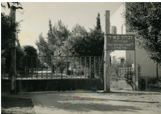
שכונת זכרון מאיר 1955