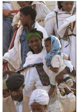
עולים חדשים מאתיופיה יורדים ממטוס לאחר הגעתם במסגרת מבצע שלמה מאדיס אבבה

ראשוני העולים מאתיופיה בתקופה המודרנית הגיעו לארץ ב-1934, יחד עם עולים מתימן. בשנים הראשונות להקמת המדינה לא נערכו מבצעים להעלאת יהודי אתיופיה לארץ, אולם בעקבות פרוץ מלחמת האזרחים באתיופיה והתדרדרות מצבם של היהודים שם הוחלט לפעול להצלתם. במהלך מבצע אחים, שהתקיים בין השנים 1979-1990, נקראו יהודי אתיופיה להגיע למחנות פליטים בסודאן, ומשם הובאו לארץ. מבצע זה כלל מבצעים נוספים, ביניהם מבצע משה, מבצע פדיון שבויים ומבצע שלמה. סך הכל עלו לארץ כ-16,000 איש. כיום מונים יוצאי אתיופיה בישראל מעל 126,000.