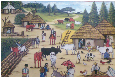
ציור של כפר יהודי אתיופי (Wikipedia, אדעולם)

הקהילות היהודיות באתיופיה היו ידועות בכינוי "ביתא ישראל". יהודים גרו באפריקה כבר בתקופת בית ראשון, וקיימות השערות שונות לגבי מוצאה המדויק של הקהילה. בשל בידודם מקהילות יהודיות אחרות, שמרו יהודי אתיופיה על מנהגים והלכות שונות משל השאר. הם לא העלו את התורה שבעל-פה על הכתב אלא העבירו את המסורות הפרשניות בעל פה. ביתא