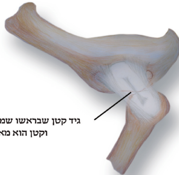
גיד קטן שבראשו שמחובר בחור וקטן הוא מאד

בתמונה נראה הגיד הקטן - ניביה לדעת רש"י - שמחובר בראש עצם הקולית. [לדעת הרמב"ם 'ניביה' הם הקרומים המחוברים את עצם הקולית עם עצם הנק"א והם סובבים את כל החיבור והם נראים בתמונה משני צידי הגיד הקטן].